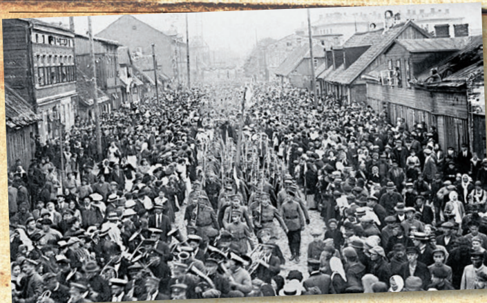
Pagaidu valdība svinīgā gājienā pa Lielo ielu.

valdības svinīgas ierašanās pilsētā. Noteiktā laikā skaisti flagotais "Saratovs" tuvojās muitas valdei, kur viņam vajadzēja apstāties; ap 20 000 lielais sagaidītāju pūlis ar skaļām un jūsmīgām ovācijām apsveica pagaidu valdību ar Ulmani priekšgalā. Pagaidu valdības locekļus, tautas lūgšanai jūsmīgi skanot, skolu jaunatne un pārējā publika apbēra ar puķēm. Mainījās latvju tautas lūgšana ar Sabiedroto tautu himnām, un visi svinīgā brīža dalībnieki liksmojās ilgi visaizgrābjošākā sajūsmā."