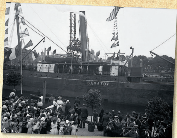
Ministru prezidents K. Ulmanis uzrunā Pagaidu valdības sagaidīšanas svinīgā pasākuma dalībniekus 1919. gada 27. jūnijā

Tvaikonis „Saratov” pie Liepājas krastiem par Latvijas Pagaidu valdības drošāko mājvietu kļūst uz nepilniem