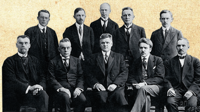
Pirmais Latvijas Ministru Kabinets

Neatkarīgās valsts sākuma periodā, līdz 1919. gada 6. decembrim Valteram nācās uzņemties apsardzības ministra pienākumus. Pievienojoties pulkveža Kalpaka ierosinājumiem par mobilizāciju, Valters iestājās arī par mazas valsts armijas ideju un sāka organizēt aizsargu nodaļas bruņotu spēku aizmugurē. Tā laika anġļu, amerikāņu un vācu novērotāji gan latviešiem draudzīgos, gan naidīgos ziņojumos Valteru apzīmēja kā spējīgāko Latvijas ministru. Pēc valsts neatkarības atgūšanas un vācu karaspēka patriekšanas Valters strādāja Latvijas diplomātiskajā dienestā.